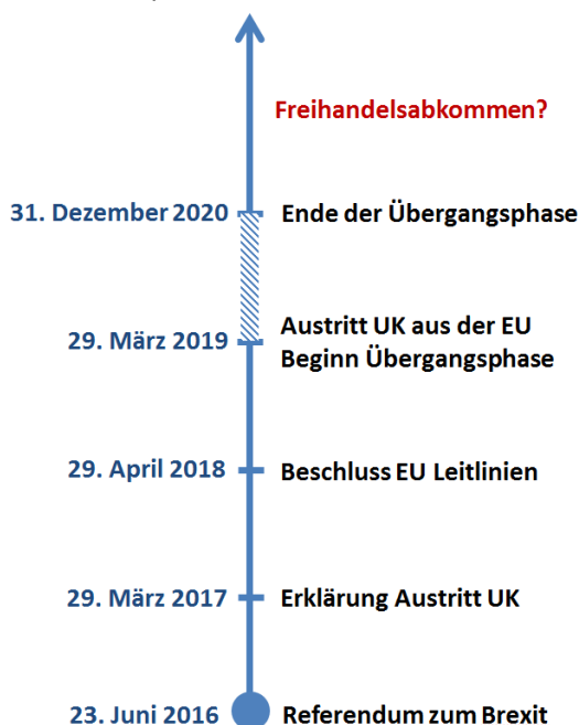
Abb. 1: Zeitplan Brexit

Aktueller Zeitplan: Am 29. März 2017 hat das Vereinigte Königreich erklärt, gemäß Artikel 50 des EU-Vertrags aus der Europäischen Union auszutreten. Am 29. April 2018 verabschiedeten die Staats- und Regierungschefs der 28 EU-Länder politische Leitlinien für die Austrittsverhandlungen. Zentral dabei ist die Einigung auf eine Übergangsphase bis Ende 2020, in der sich für die Wirtschaft auf beiden Seiten zunächst einmal nichts ändern soll. Zudem will die EU den Briten ein umfassendes Freihandelsabkommen anbieten. Das harte Ausscheiden aus der EU ganz ohne Abkommen („No-Deal-Szenario“), nach dem das Land anschließend auf einer Stufe mit jedem anderen WTO-Land stehen würde, ist damit unwahrscheinlicher geworden. Ausgeschlossen ist angesichts der Zerrissenheit der britischen Regierung aber nichts.